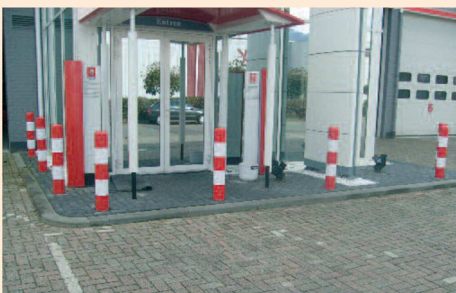
Afschermpaal Ø159 aardebaan rood/wit