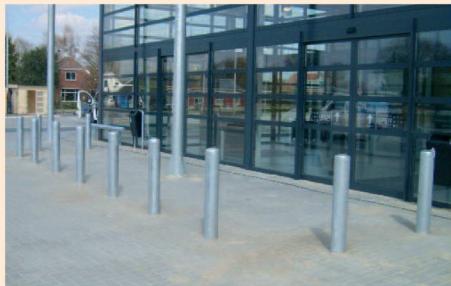
Afschermpaal Ø159 aardebaan verzinkt