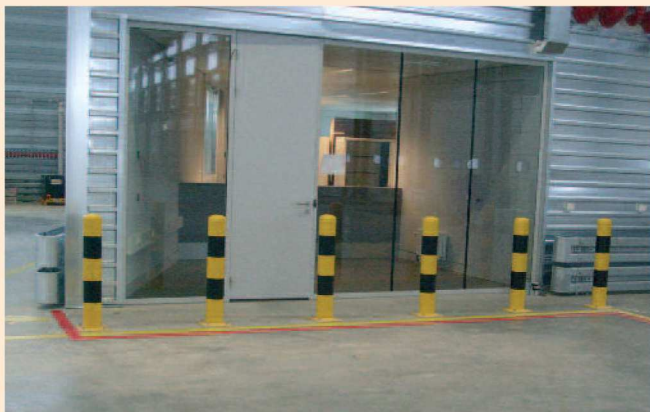
Afschermpaal Ø159 op voetplaat geel/zwart