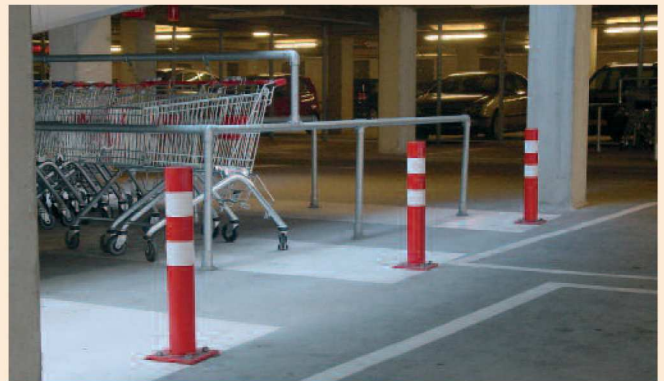
Afschermpaal Ø101x700 rood/wit