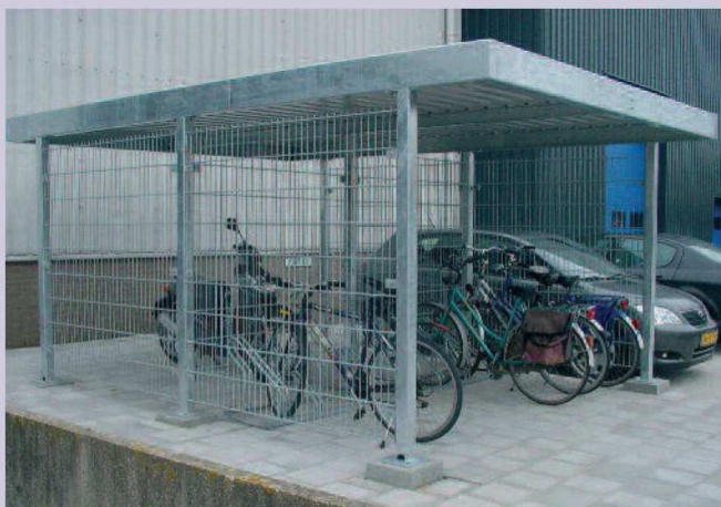
H-100 dubbelstaafs matten dubbel uitgevoerd