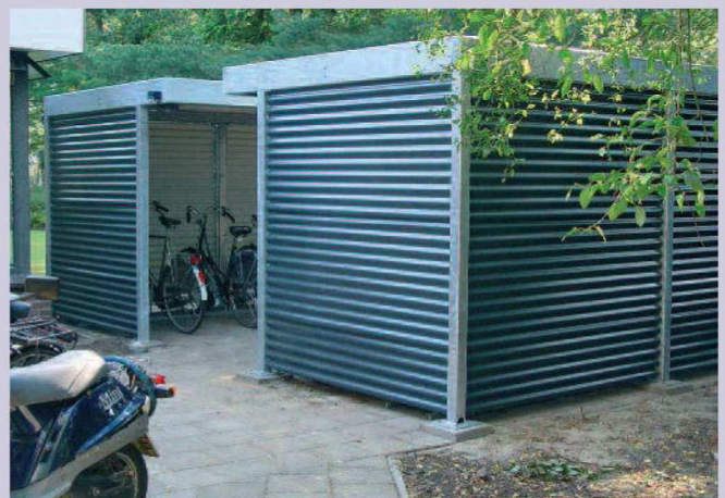
H-100 geprofileerde staalplaat verzinkt