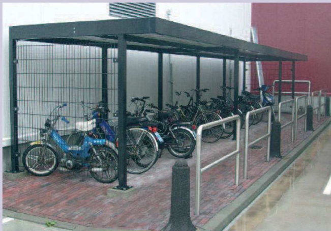
H-100 dubbelstaafs matten gepoedercoat

aangesloten worden op de riolering. Door de toepassing van zeer degelijk materiaal is deze stalling bestand tegen vandalisme. Het stalen thermisch verzinkte frame wordt in onze poedercoaterij optioneel gecoat in elke gewenste RAL-kleur.