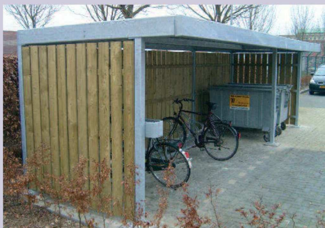
H-100 geïmpregneerd hout verzinkt