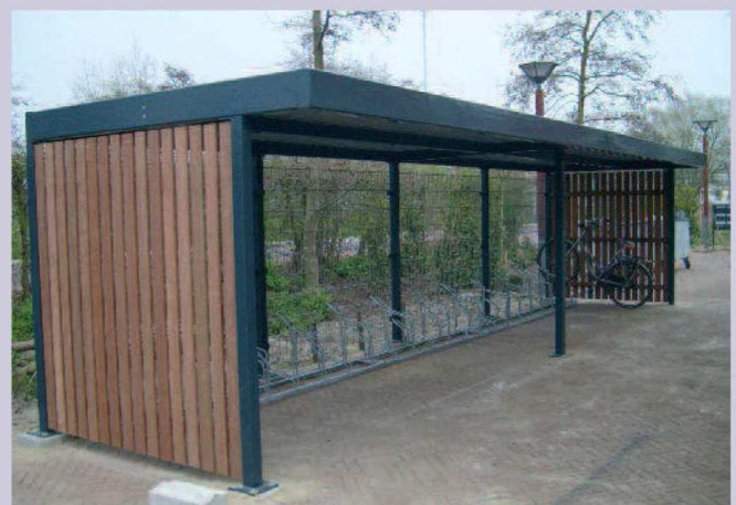
H-100 hardhout dubbelstaafs matten