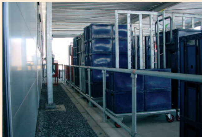
Lichte aanrijdbeveiliging dubbel

Als alternatief voor een vangrailconstructie kan op plaatsen waar alleen licht transport plaatsvindt, bijvoorbeeld daar waar rolcontainers, palletwagens of winkelwagens rijden, gekozen worden voor een buisconstructie als lichte aanrijdbeveiliging. Het systeem bestaat uit thermisch verzinkte buizen die door middel van gietijzeren koppelingen onderling verbonden worden. Het geheel wordt met montageankers aan de grond verankerd. Het buiskoppelsysteem is een bijzonder flexibel systeem dat een lichte maar doeltreffende aanrijdbescherming biedt.