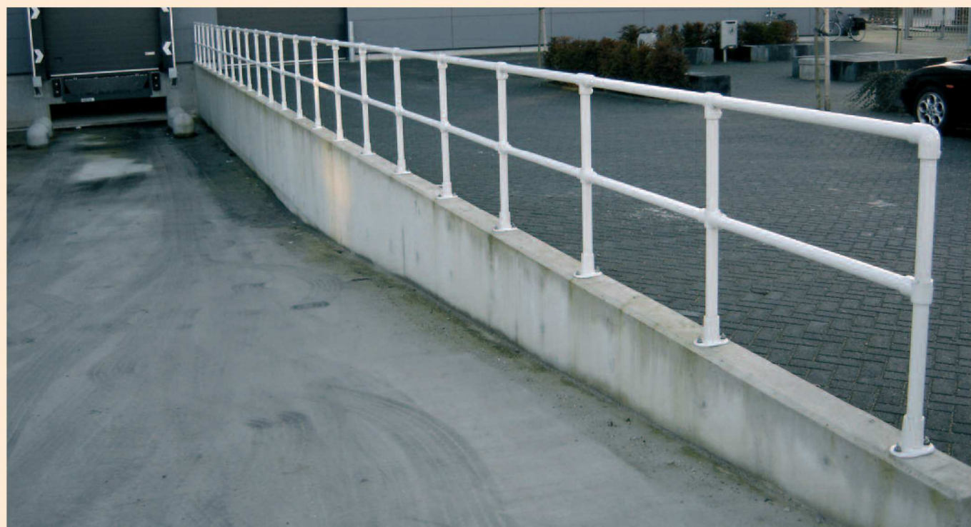
Lichte aanrijdbeveiliging dubbel