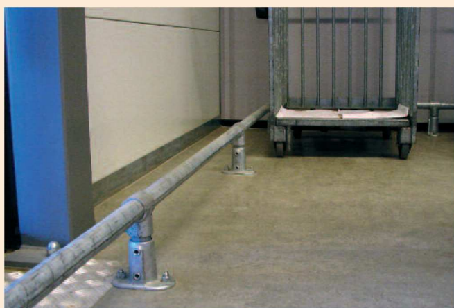
Lichte aanrijdbeveiliging laag