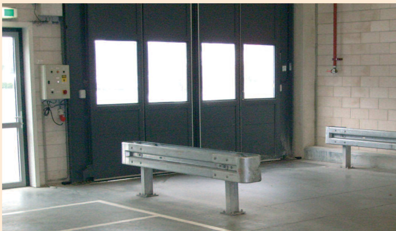
Vangrail B-profiel dubbelzijdig