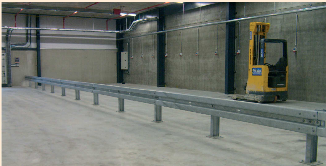
Vangrail B-profiel bij acculaadstation

Voor de afscherming van looppaden, machines of installaties is hoge vangrail een betere optie dan lage vangrail. Deze constructie biedt voor genoemde toepassingen een betere bescherming en valt daarnaast meer op waardoor er geen struikelgevaar is.